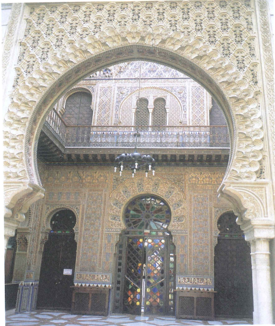
Sala neomudéjar del Casino de Murcia.